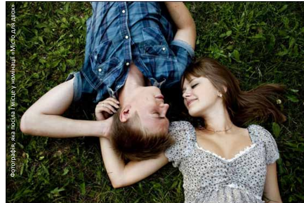
фотографія, яка посіла 1 місце у номінації «Місто для двох»